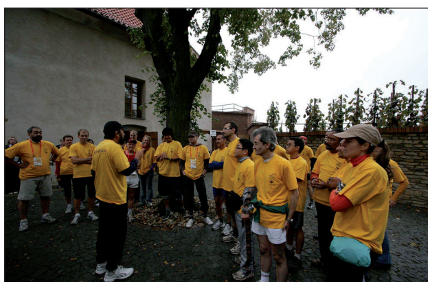
Obr. 11., obr. 12. Mladí čeští psychiatři zorganizovali „Běh pro duševní zdraví“. I přes počáteční nepřízeň počasí se vše nakonec v dobré obrátilo.