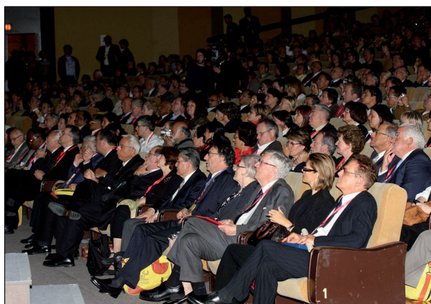
Obr. 6. Velký sál Kongresového centra Praha byl během zahajovacího ceremoniálu zcela zaplněn.