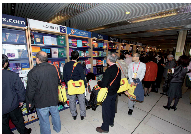
Obr. 10. V předšálí měli účastníci možnost nakoupit si zahraniční literaturu.