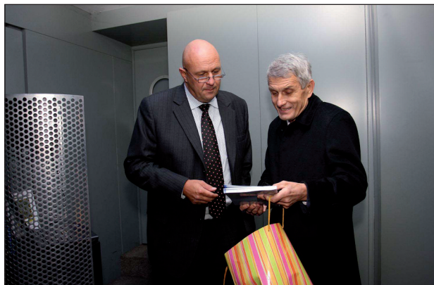
Obr. 3. K návštěvě kamionu se nechal zlákat i současný ministr zdravotnictví Tomáš Julínek.