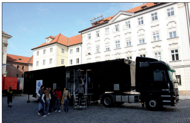
Obr. 2. V souvislosti s konferencí WPA přijel do Prahy i známý černý kamion, který je hlavní součástí aktivity společnosti Janssen Cilag, seznamující veřejnost, ale i odborníky, se schizofrenií. Projekt „Cesta dlážděná strachem“ komutuje mnoho psychiatrů velmi pozitivně a jsou přesvědčeni, že jde o skutečné napodobení prožitků jejich pacientů. Jedná se o malý simulátor pro jednoho člověka, vytvářející kombinace zvuků a pohybů, které pomocí vizuálních efektů navozují každodenní pocit pacientů a zprostředkovávají vizuální a sluchové halucinace. Člověk, který je právě v kabině, se dívá očima pacienta na každodenní stresové situace a možné podněty, které vyvolávají symptomy onemocnění. Zážitek ve speciální kabině je obtížné popsat, nejlepší je ho prožít. Je to zkušenost, na kterou mnoho lidí nezapomene.