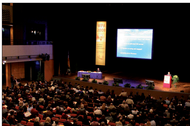
Obr. 8. Přednášky, zejména slavných veličin světové psychiatrie, se těšily v průběhu kongresu velké pozornosti posluchačů.