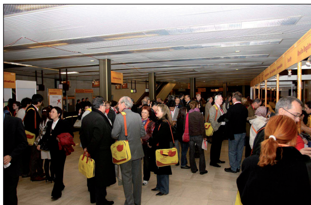
Obr. 4. V sobotu 20. září vše vypuklo! Registraci muselo projít téměř 7000 účastníků konference.