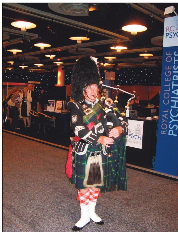
Obr. 1. První den vítal účastníky konference typický skotský dudák.

Plenární přednáška prof. C. Blakemora z Medical Research Council (instituce přidělující ročně asi 70 milionů liber především na výzkumné pro-