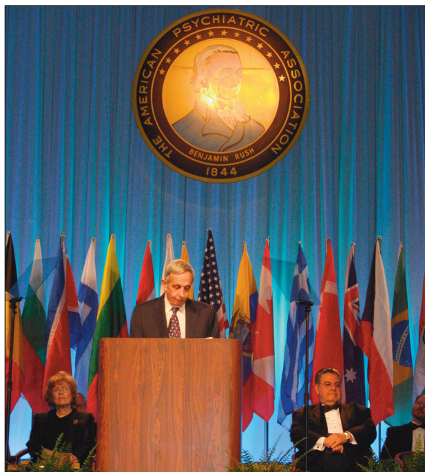
Obr. 2. Přednáška nositele Nobelovy ceny Johna Nashe, kterého uvedl prezident APA Pedro Ruiz.